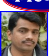
रि.कू. मिश्रा, संवाददाता