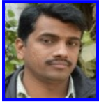
रि.क. मिश्री, संवाददाता