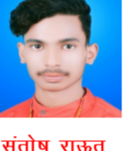
संतोष राजत न्यूज़ टुडे,