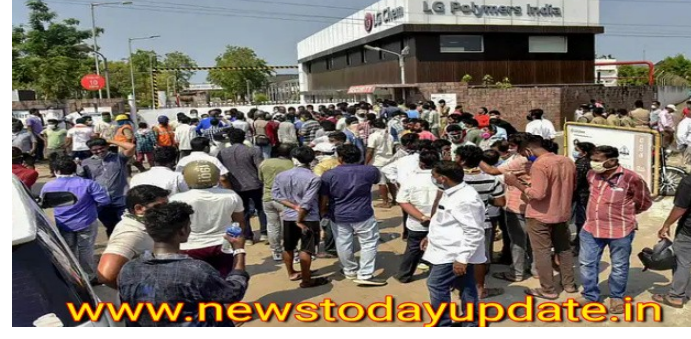
सह-पॉलिमर निर्माण के लिए 'हिंदुस्तान पॉलिमर' के रूप में की गयी थी. बाद में 1978 में यूबी गुप के मैकडॉवेल एंड कंपनी लिमिटेड के साथ इसका विलय हो गया.

एलजी केम ने आक्रामक ग्लोबल ग्रोथ स्ट्रीम के तहत भारत को महत्वपूर्ण बाजार मानते हुए जुलाई 1997 में हिंदुस्तान पॉलिमर का अधिग्रहण किया और जुलाई 1997 में इसका नाम बदलकर एलजी पॉलिमर इंडिया प्राइवेट लिमिटेड (एलजीपीआई) कर दिया।