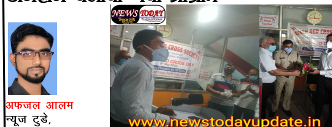
आज विश्व रेड क्रॉस दिवस पर रेड क्रॉस मोतीहारी में मारवाड़ी युवा मंच द्वारा ब्लड डोनेशन प्रोग्राम चलाया गया

विश्व रेड क्रॉस दिवस पर रेड क्रॉस मोतीहारी में मारवाड़ी युवा मंच द्वारा ब्लड डोनेशन चलाया गया प्रोग्राम